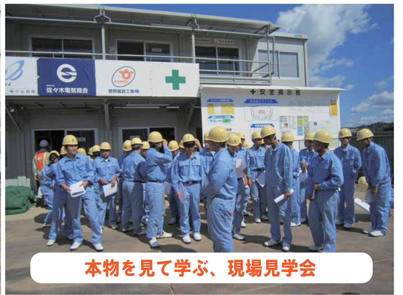
本物を見て学ぶ、現場見学会