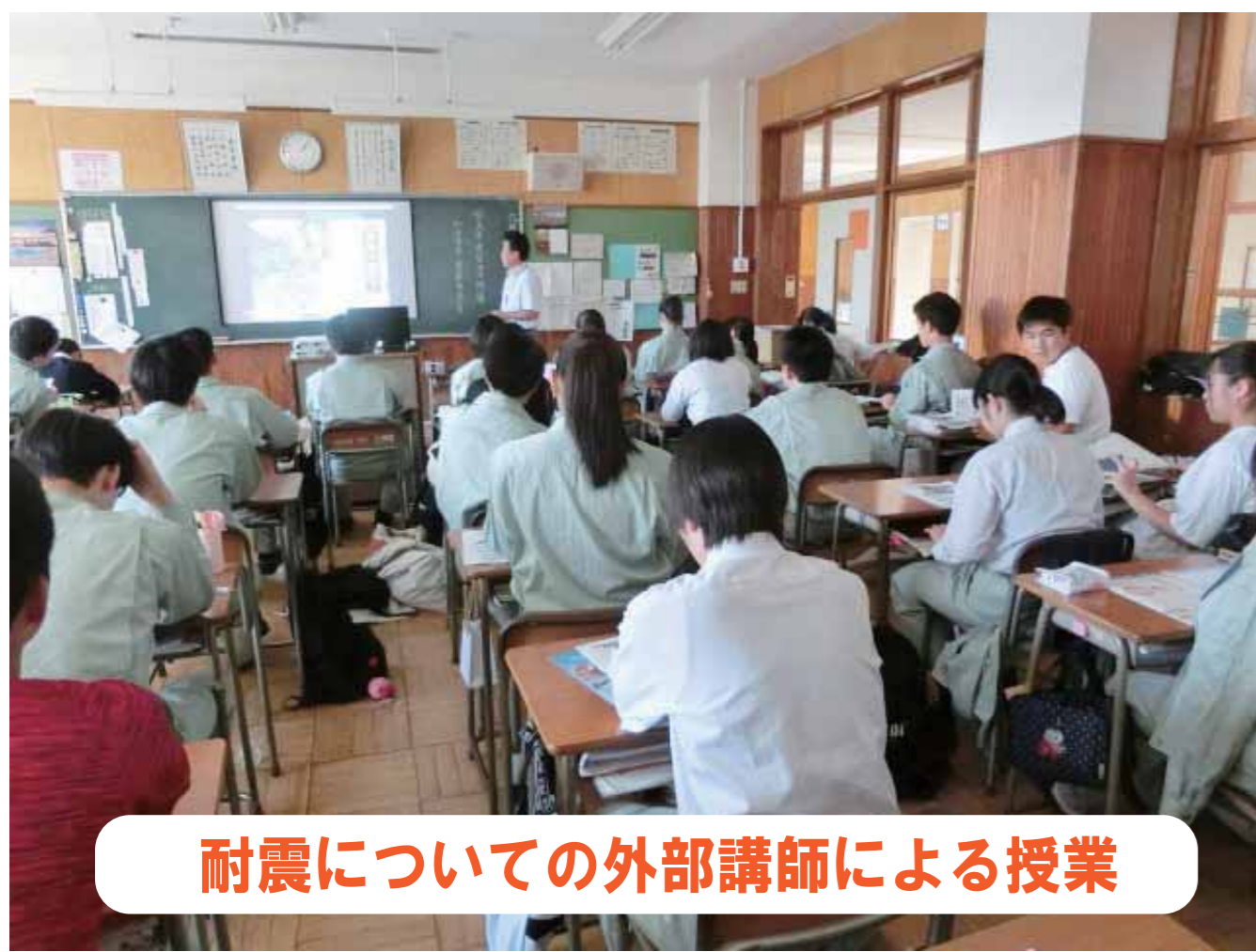
耐震についての外部講師による授業