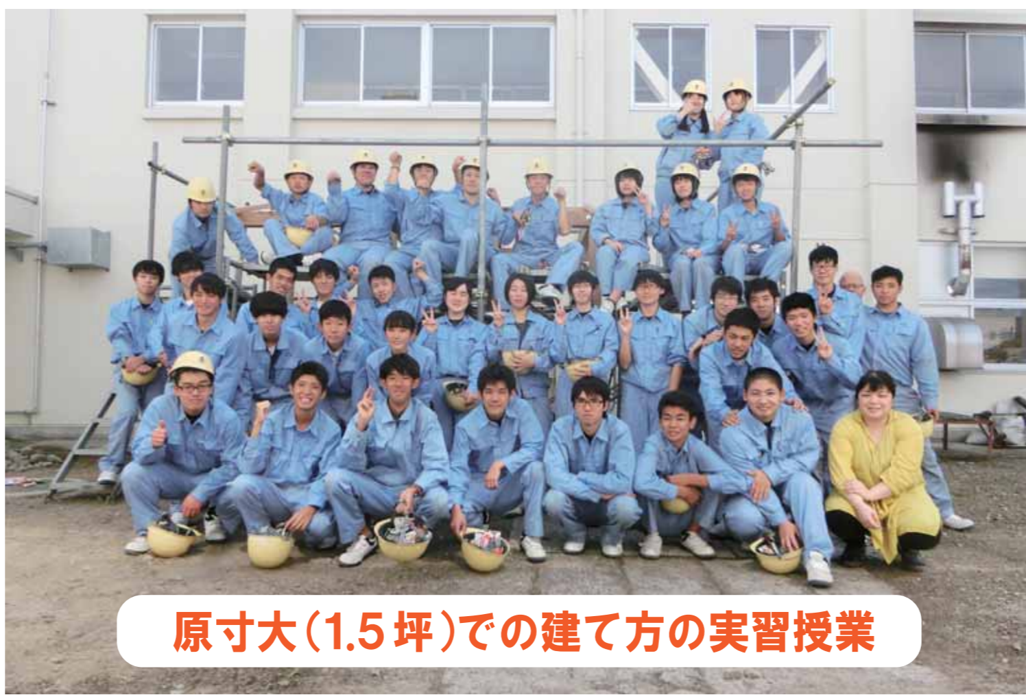
原寸大(1.5坪)での建て方の実習授業