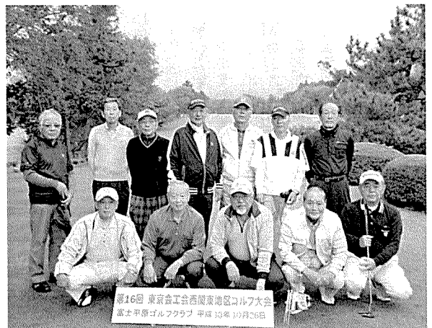
第16回 東京會工会西地区ゴルフ大会 富士平原ゴルフクラブ 平成30年10月26日

前年までは、御殿場ゴルフ倶楽部で開催していたのですが、今年は宿泊所に近く高齢者にも易しい平坦なコースでのコンペとなりました。参加者の顔触れは、昭和三十年代に卒業した大先輩四名を含め、ゴルフ利用税が免除される七十才以上の先輩が九名で、利用税を払ったのは三名だけでした。