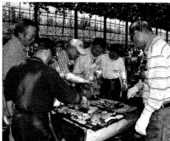
▶平成二十六年度のパーベキュー