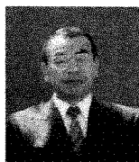
会津工業高等学校 校長