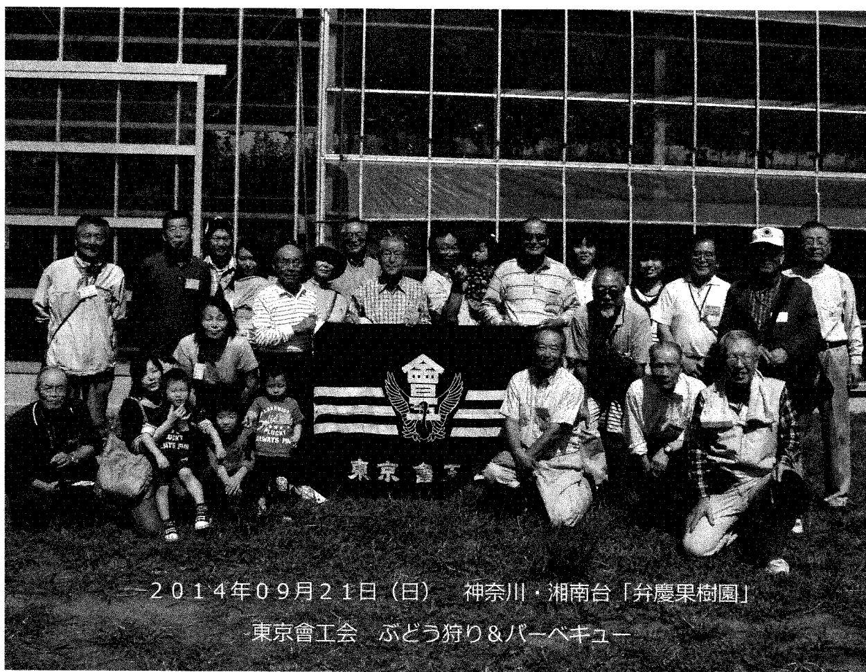
2014年09月21日(日) 神奈川県・湘南台「弁慶果樹園」

満腹となったところで、誰もいない広い庭に出て大声で校歌・応援歌を斉唱し、散会となりました。