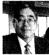
東京会工会会計幹事