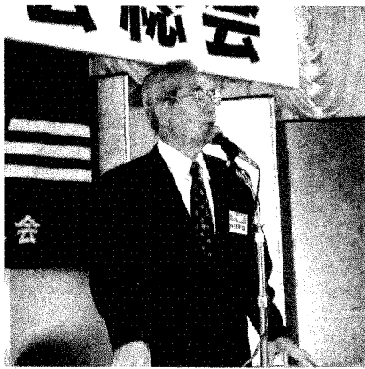
挨拶する赤津会長

平成十四年六月二十二日(土)東京会工会総会に出席しました。私が本総会に出席するようになって十年以上になります。毎年恒例となった上野の精養軒での開催は、関東一円に住んでいる会員には便利の良いところだと思えます。今回は、會津工業高等学校の学校長、會工同窓会長、東海會工会副会長、近畿會工会会計幹事の方々を来賓として迎え、総勢九十四名の参加により盛大に行われました。