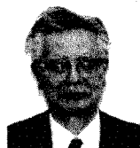
横浜国立大学名誉教授