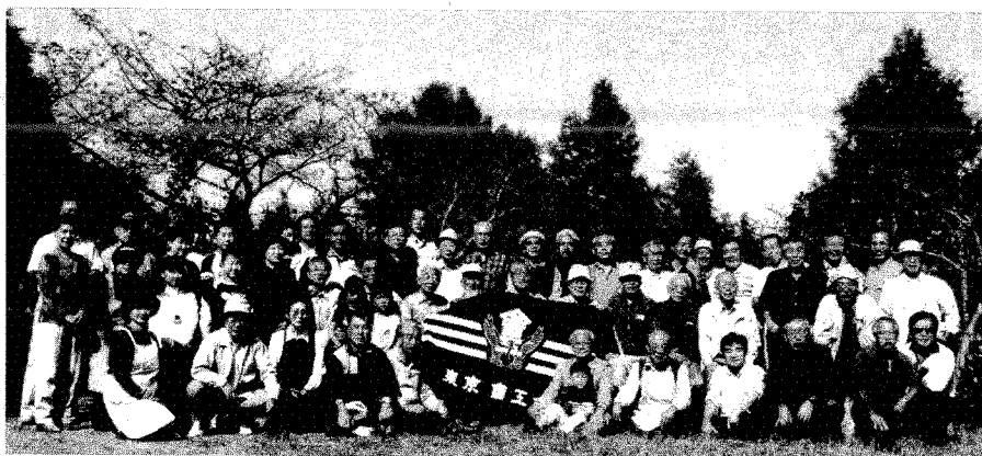
澄みきった秋空の下 芋煮会だよ! 全員集合!!